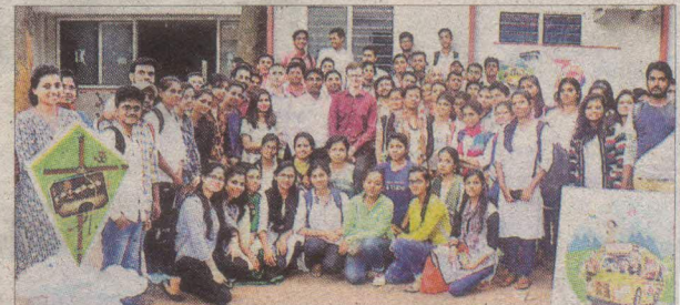
भारत-स्विट्जरलैंड की दोस्ती पर पांच मिनट की वीडियो क्लिप दिखायी गयी।

रांची. स्विस-भारत के 70 वर्ष की दोस्ती पर झारखंड के केंद्रीय विश्वविद्यालय में एक फिल्म प्रदर्शन की गयी। फिल्म प्रदर्शनी की शुरुआत भारत-स्विट्जरलैंड की दोस्ती पर पांच मिनट की वीडियो क्लिप के साथ हुई। स्विस फिल्मस ऑन व्हील्स के तहत 'माई लाइफ ऐज अ जूकीनी' फिल्म प्रदर्शित की गयी, जो कि दोस्ती पर