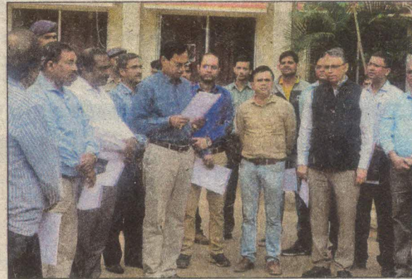
गुरुवार को सीयूजे में भ्रष्टाचार मुक्त भारत थीम पर कर्मचारियों को शपथ दिलाई गई